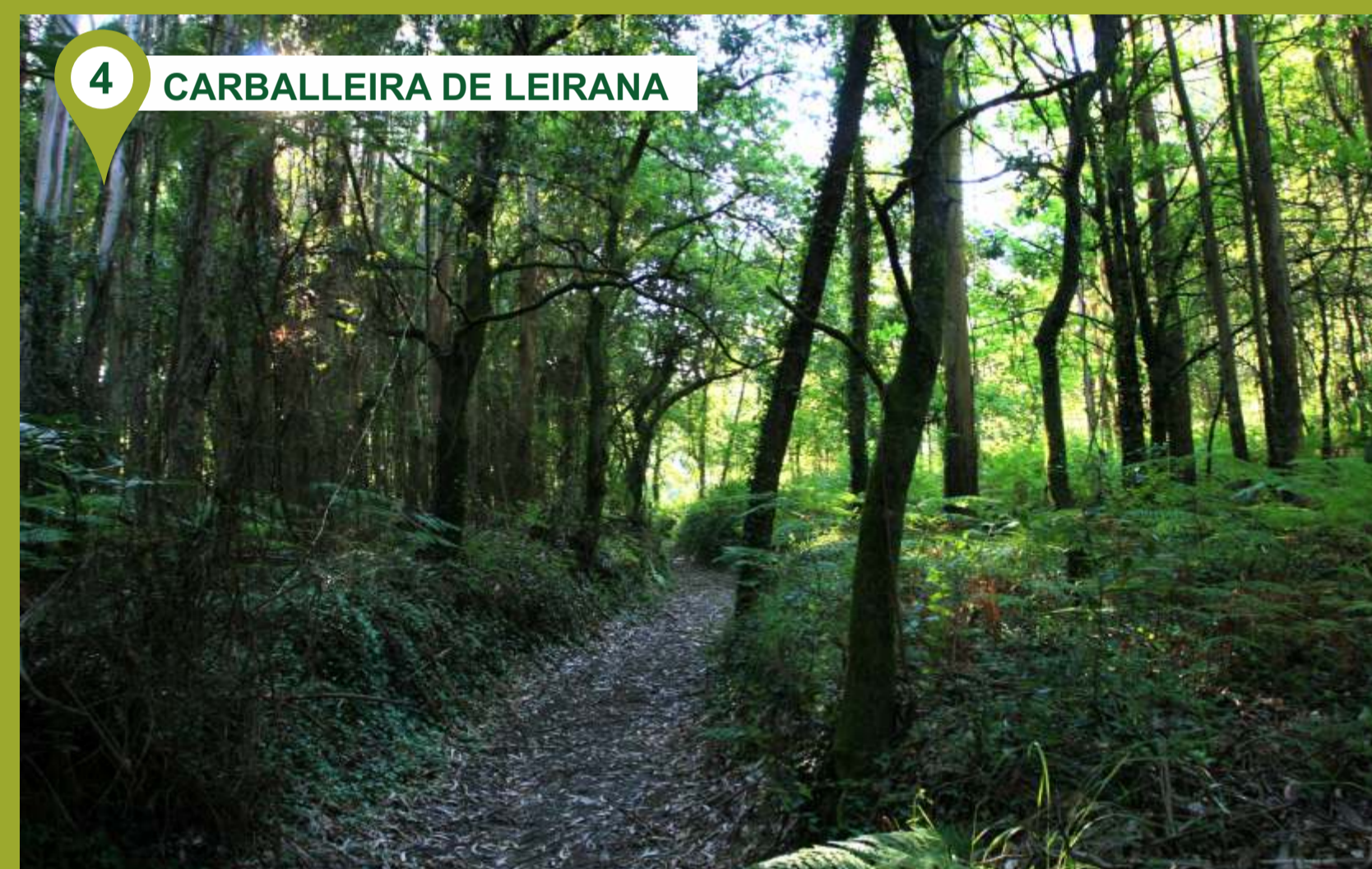
4 CARBALLEIRA DE LEIRANA

En la cota de máxima altitud de la ruta tenemos muestra de un conjunto megalítico de Sanxenxo denominado "Chan da Gorita", formado por varias mámoas o túmulos bajo los cuales se dispusieron las grandes piedras en forma de corredor de acceso y cámara (tendiendo al circular) para el enterramiento (individual o colectivo) con agua en algunas ocasiones (2000-1000 a. C.). Hoy en día están tapados por tierra y densa vegetación, aunque la paciencia e intuición, fijándose en la protuberancia del terreno, nos pueden dar la clave.