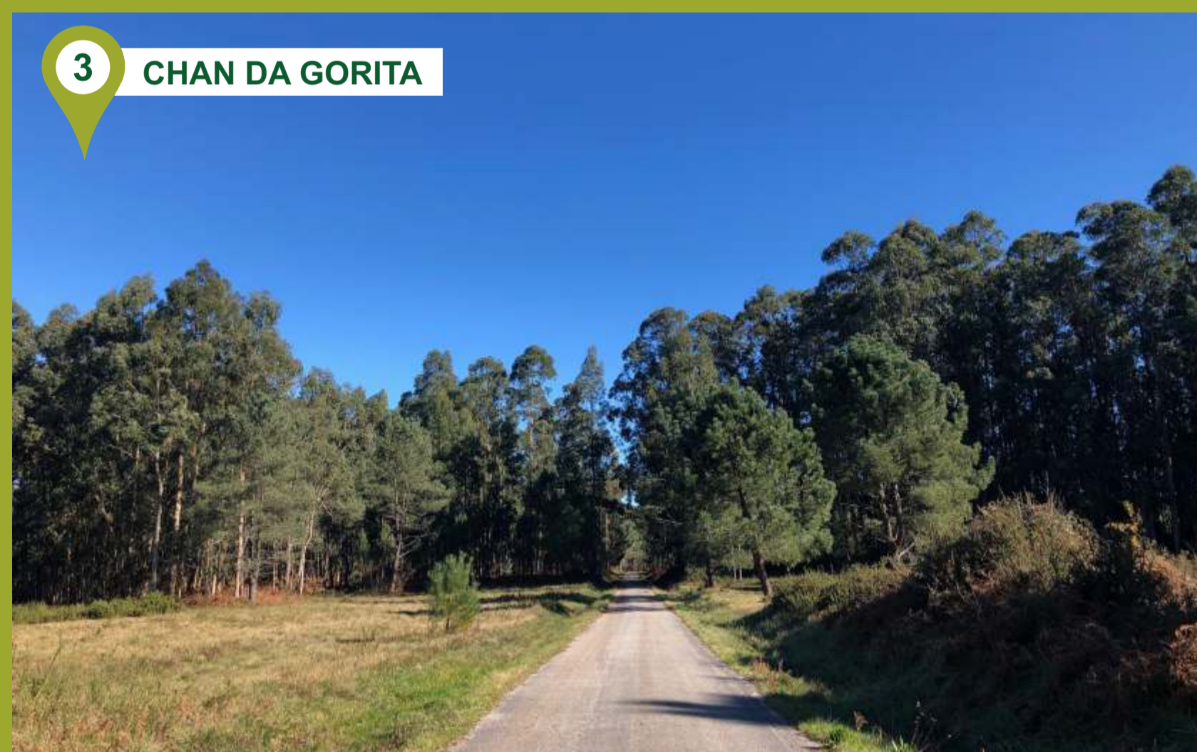
3 CHAN DA GORITA