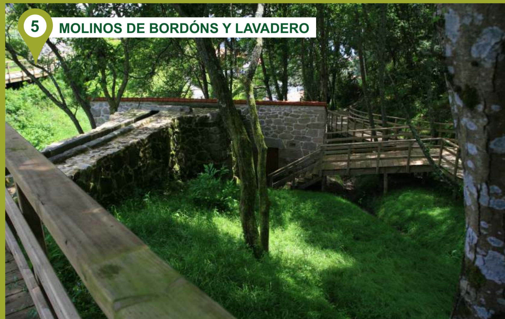
5 MOLINOS DE BORDÓNS Y LAVADERO