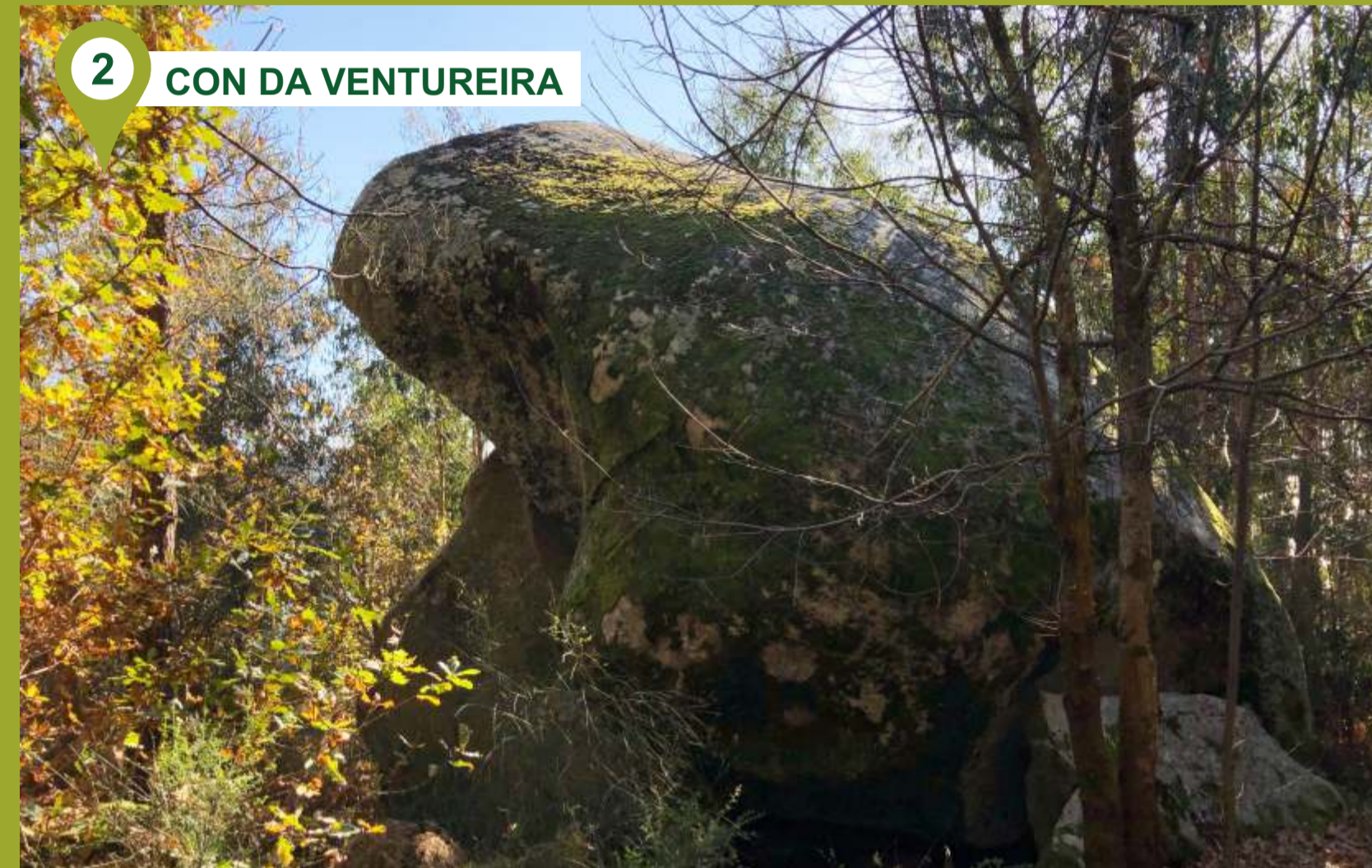
2 CON DA VENTUREIRA

Aldariz es uno de los lugares habitados más elevados de la parroquia de Padriñán (Sanxenxo), donde podemos contemplar su famosa fuente-lavadero, aparte de otros ejemplos de arquitectura popular (hórreos y casas antiguas). Tomando con referencia el sentido de las agujas del reloj, subiremos hacia el monte, adentrándonos en plena naturaleza y podremos disfrutar del Sanxenxo más desconocido.