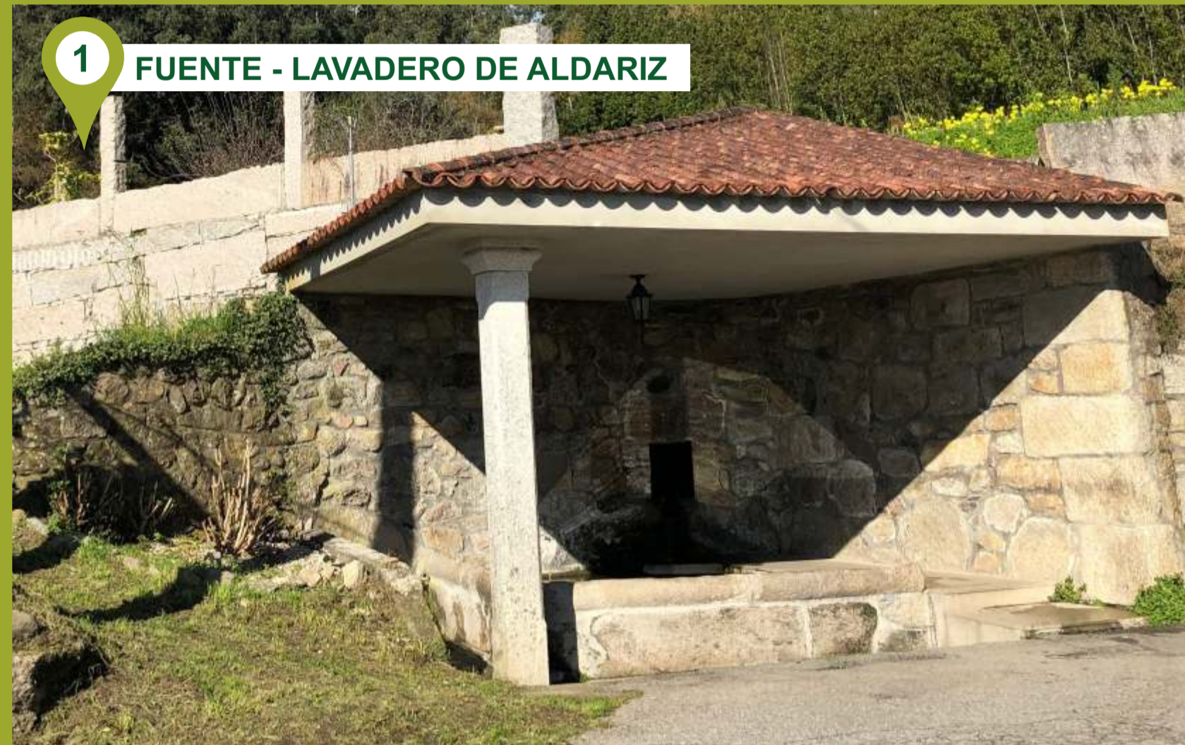
1 FUENTE - LAVADERO DE ALDARIZ

TELÉFONOS DE INTERÉS Ayuntamiento: 986 720 075 Policía Local: 986 727 072 Guardia Civil: 986 720 252 Centro de Salud de Baltar: 986 723 128 Emergencias: 112