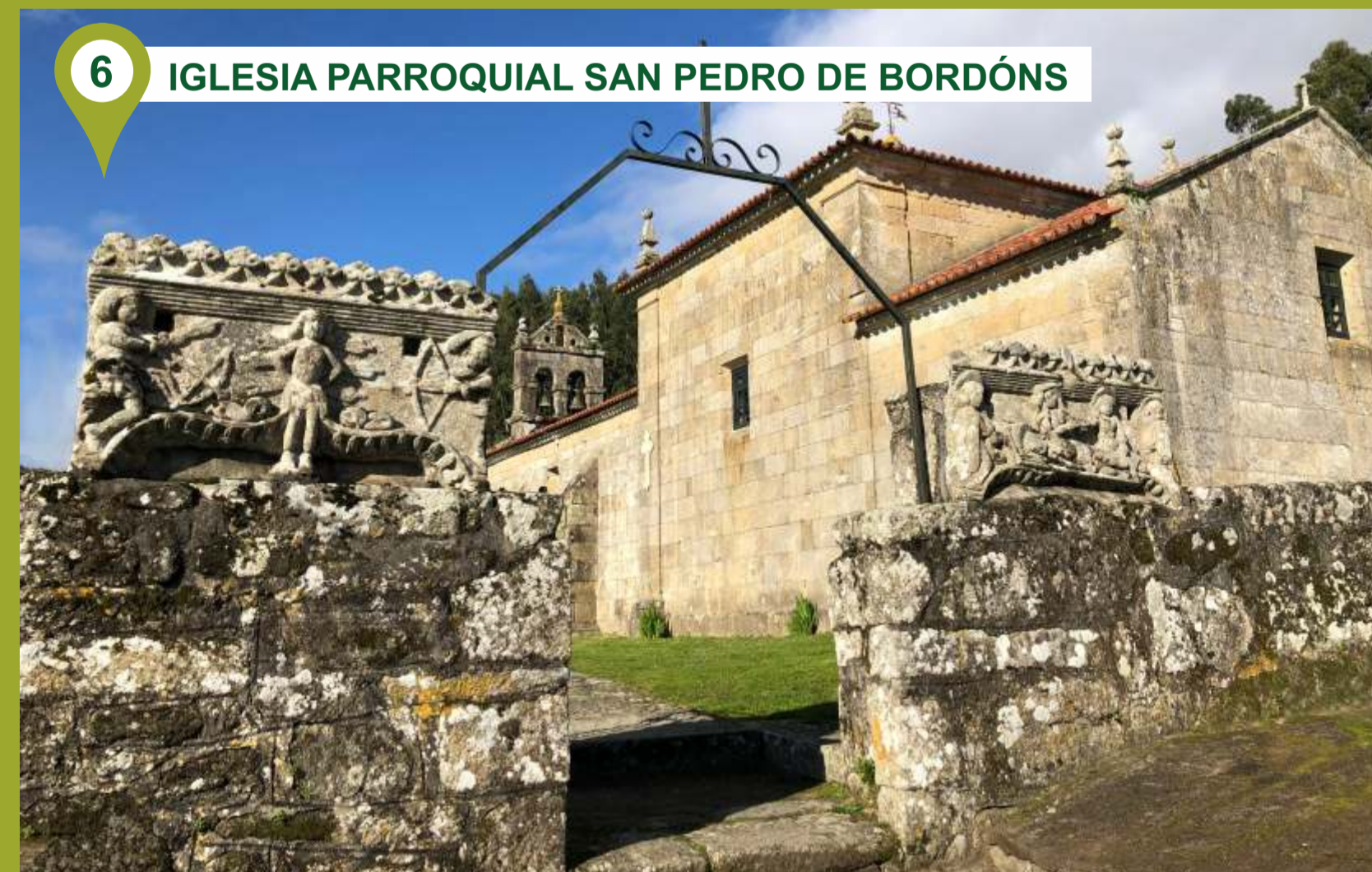
6 IGLESIA PARROQUIAL SAN PEDRO DE BORDÓNS

En la parte más al sur de la ruta, en la parte baja del núcleo de Bordóns podemos visitar un molino de agua, varias fuentes y un lavadero. El molino es de dimensiones considerables, teniendo dos ruedas y un gran canal. En las cercanías otro molino está destinado la hostelería.